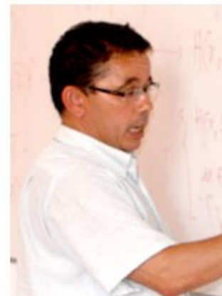
Pr Moez Dimassi