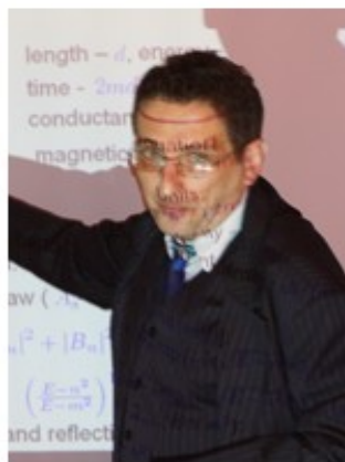
Pr Oleg Olendski