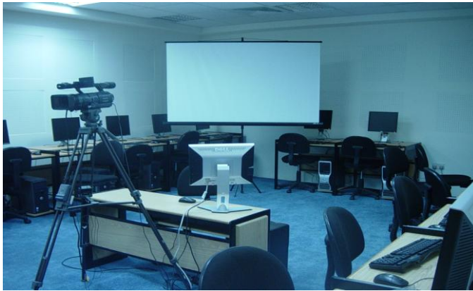
صورة توضح المبنى من الداخل

تمت توسعة وإعادة تأهيل مركز الحاسوب وانشاء مركز ابن سينا للتعلم عن بعد بمساحة اجمالية بلغت 325 م 2 بحيث كان العمل على جزئين الأولى في موقع مركز الحاسوب الحالي والمنوي تطويره بحيث يستوعب التنظيم الاداري ضمن مركز الحاسوب والجزء الثاني في موقع المركز الصحي القديم والمنوي تحويله الى مختبر فحص ICDL ومركز لجامعة ابن سينا الافتراضية والعطاء يشمل ملحق لتنفيذ حاضنة الأعمال التكنولوجية في كلية الهندسة.