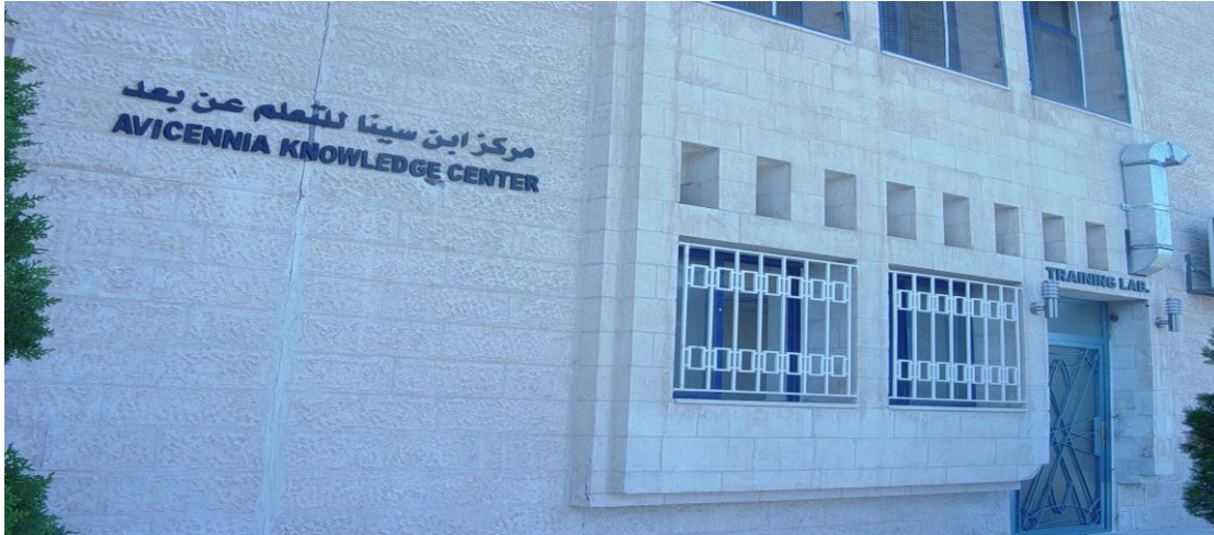
صورة توضح المبنى من الخارج

1. استلام أعمال عطاء رقم 2006/8 لمشروع توسعة وإعادة تأهيل مركز الحاسوب ومركز ابن سينا للتعلم عن بعد.